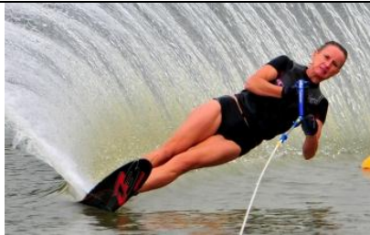
Fig 1 : objet la skieuse nautique