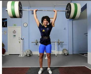
Fig 2 : objet les haltères