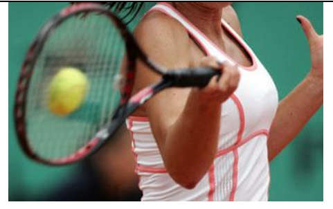
Fig 3 : objet la balle