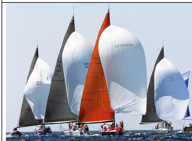
Fig 3 : Au cours d'une régates la vitesse du bateau augmente grâce au déploiement des voiles.