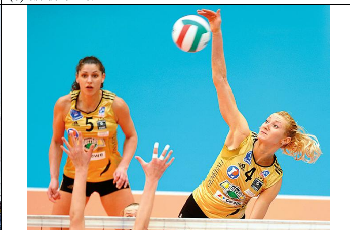
Fig 4 : Au volley-ball la balle est déviée.