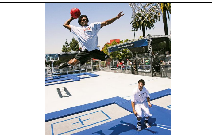
Fig 2 : Au slam-ball le sportif est en l'air (a) et le trampoline (b) est déformé.